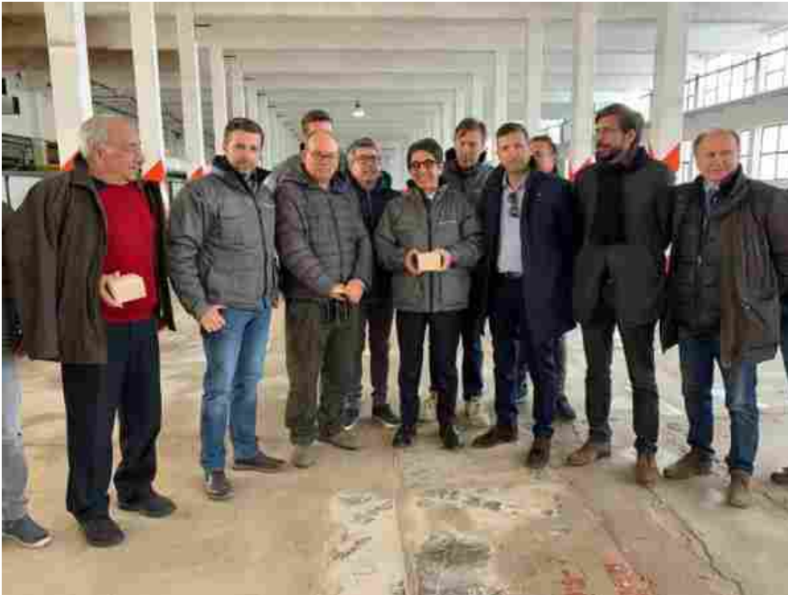
Foto di gruppo per il riavvio ufficiale della fase produttiva dell'ex Ideal Standard di Roccasecca